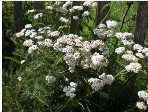
Duizendblad in bloei