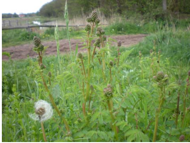
Rode pimpernel - bloemknoppen