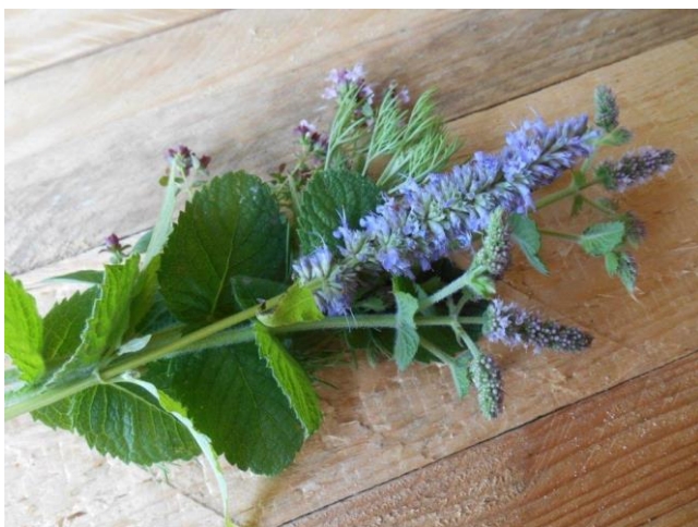
Maak in de hand een bosje voor een mooi resultaat in een smalle karaf...

Helemaal hip en trendy en o zo gemakkelijk uitvoerbaar.