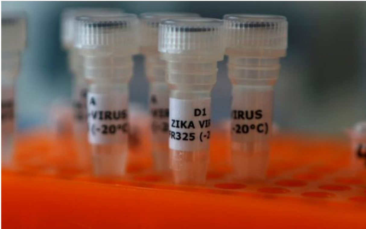
Tubes with the label 'Zika virus' are seen at Genekam Biotechnology AG in Duisburg, Germany, February 2, 2016.

Om de verspreiding te vergemakkelijken is het een “seksueel overdraagbaar virus”. Net nu het Carnaval in Rio is, dat belooft wat. In Duisburg verwachten ze na de Carnaval ook een uitbraak, gezien de aanwezigheid van het ZIKA virus in een laboratorium in Duisburg. Soms moet de natuur een handje worden geholpen, hè!