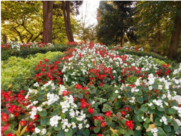
Botanische tuin De Jochumhof in Steyl