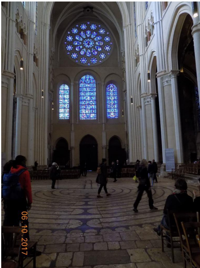
Kathedraal van Chartres

Nu lijkt het allemaal weer te stromen en dat geeft wat meer ademruimte.