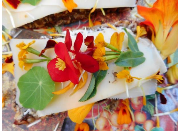
'Wild' broodje gezond

In Limburg een mooie dag beleefd in de kruidentuin te Tegelen bij Steyl en in Steyl bij de Jochumhof, een botanische tuin. Op 1 maart gaan we weer aan de wandel en dan gaan we naar Elsloo waar we zeker van het daslook gaan genieten.