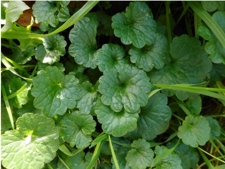
Pag. 18: Look-zonder-look, hierboven: Hondsdrif

Wat erg raar was waren de dennenbomen die in het recreatiegebied Madestein stonden.