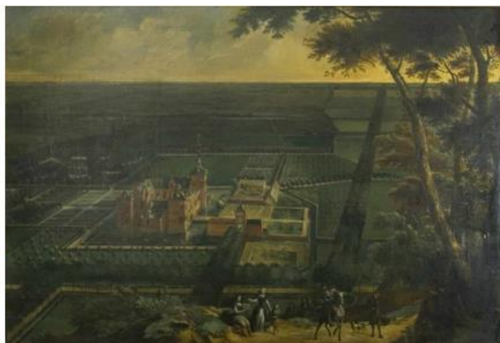
Zicht op het kasteel van Schoten door Gaspar de Witte en Gonzales Coques (ca. 1680), te bezichtigen in het kasteel van Schoten.

Al in de 12e eeuw ontstond naast een kerkelijk Schoten (Schoten zou gekerstend zijn door de heilige Ursmarus, abt van de abdij van Lobbes. Deze abdij had bezittingen te Schoten) een wereldlijk Schoten onder de bevoegdheid van de heren van Breda (de vlaggen van Schoten en Breda zijn gelijk).