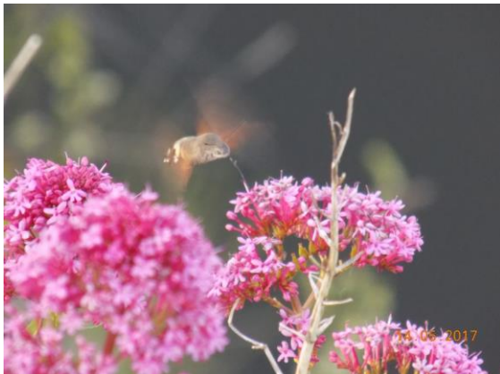
Veel kolibrievlinders in Saint Cirque

Aanstormende gier in Rocher des Aigles bij Rocamadour